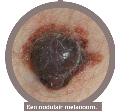
Een nodulair melanoom.