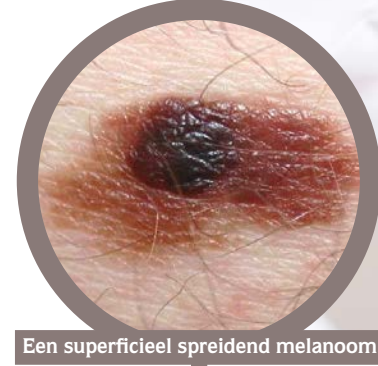
Een superficieel spreidend melanoom.